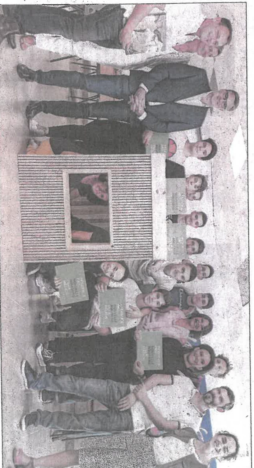
Photo de famille avec élus et professeurs dans et autour du prototype, une version plus réduite de leur Urban Cadre qu'ils ont inventé.

Ils ont inventé, l'Urban Cadre, un mobilier doté d'un banc qui fait face à une ouverture en forme de cadre et que l'on pose devant un paysage urbain qui a été reproduit un jour par des artistes ou que l'on retrouve sur des cartes postales anciennes. « Positionné à l'avant